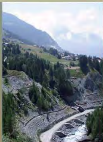
Sistemazione versante torrente Molero