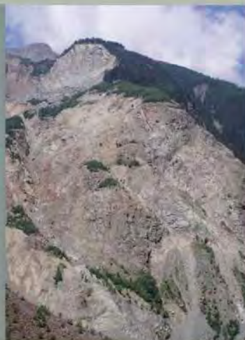
Frana della Val Poja