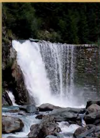
Biglia sul torrente Molero